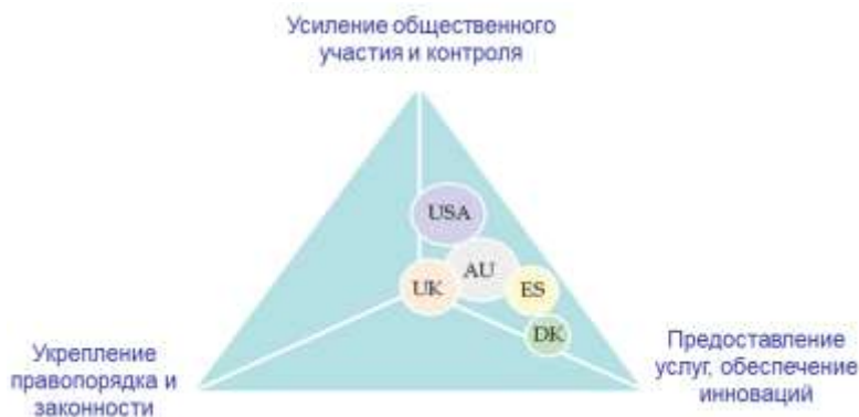
Рисунок 2. Приоритеты в открытии государственных данных

У каждой из стран и организаций имеются свои мотивы для открытия данных (рис. 2). В США, к примеру, кампания за открытые данные была начата с целью более широкого информирования граждан о том, каким образом и на что тратятся средства налогоплательщиков. Индия пытается таким образом бороться с коррупцией. В Великобритании прозрачность официальных данных необходима в основном для проведения реформ в публичном секторе и ускорения роста инноваций в бизнесе (второе – удается лучше - http://www.economist.com/node/21552269 ).