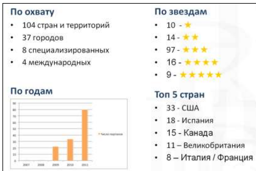
Рисунок 1. «География» открытых государственных данных

Сейчас на порталах открытых данных собраны значительные массивы информации, объединённые общим правилом: вся информация раскрывается в форме, пригодной для повторного использования и машинной обработки.